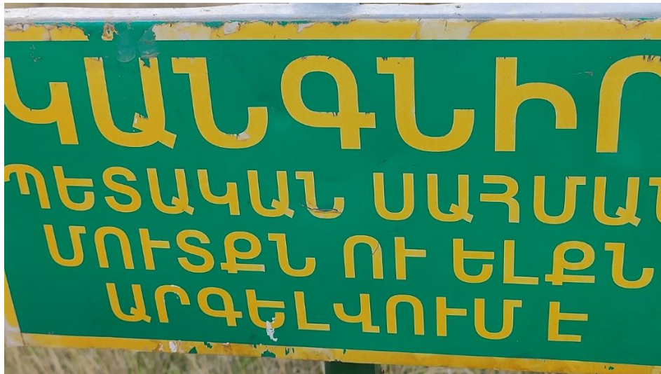
Նկ. 4 «Պետական սահման մուտքն ու ելքն արգելող» ցուցանակ Կոռնիձորից: