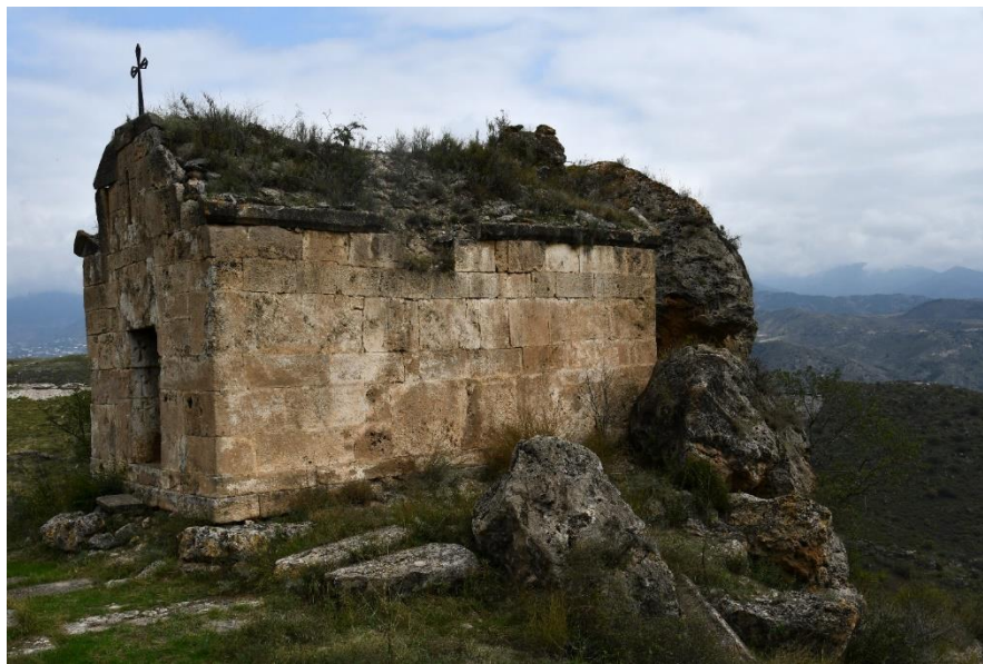
Նկ. 2 Սոնեղցի եկեղեցին:

Սոնեղցի անունը ստուգաբանվում է որպես բլրի գագաթին գտնվող եկեղեցի (Նկ. 2), սարալանջին գտնվող եկեղեցի. սեռ՝ բլրի գագաթ, եղցի՝ եկեղեցի [Տեր-Մինասյան 1986, 60; Խուրշուդեան 2022, 399]: Կառույցը V-VI դարերի միանավ թաղածածկ սրահ է՝ 7.77 x 5.41 մետր արտաքին չափերով [Հասրաթյան 1985, 244]: Եկեղեցին կանգնեցված է երկաստիճան գետնախարսի վրա: Արևելյան կողմում ունի շեշտված պայտաձև հատակագծով խորան՝ ներառված արտաքին պատերի ուղղանկյուն ծավալի մեջ: Պայտաձև է նաև խորանի կամարը: