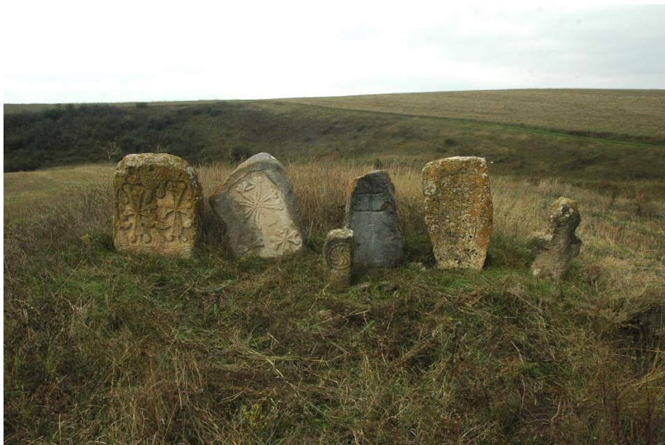
Նկ. 3 Կոռնիձոր գյուղի «Շուռնուխի խաչեր» կոչվող հուշարձանը, լուս.՝ Monumentwatch խմբի:

Բացի հուշարձանի պատմական, ճարտարապետական կարևորությունն ու հետազոտական աշխատանքների անհնարինությունը՝ Սոնեղցին, նույն կարգավիճակում գտնվող Կոտրած եղցու հետ միասին, նաև կարևոր և հիմնական ուխտատեղիներից է Տեղի և շրջակա գյուղերի բնակիչների համար: Եթե սկզբնական շրջանում հնարավոր էր համայնքային իշխանությունների թույլտվությամբ և ուղեկցությամբ սահմանափակ ժամանակով մոտենալ հուշարձաններին, ապա սահմանային իրավիճակի լարման ընթացքում հուշարձանները դառնում են անհասանելի: