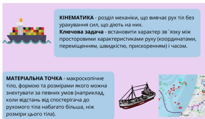
Рисунок 2. Фрагмент опорного конспекта из электронного курса «Физика и основы технической механики».

Теоретический блок содержит материалы, которые раскрывают фундаментальные вопросы занятия, в формате видеуроков, видеоопытов, опорных конспектов. Фрагмент опорного конспекта представлен на Рисунке 2.