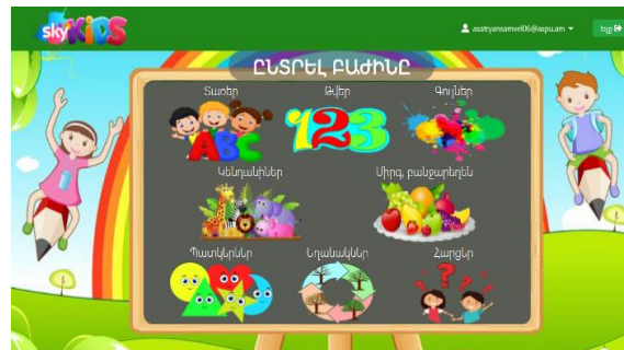
Նկ. 2. Ընտրել բաժինը

Համակարգի կիրառությունը շատ հեշտ է: Այն պահանջում է նվազագույն տեխնիկական հագեցվածություն՝ համացանցից միացված համակարգիչ կամ դյուրակիր պլանշետ, համացանցային դիտարկչով: