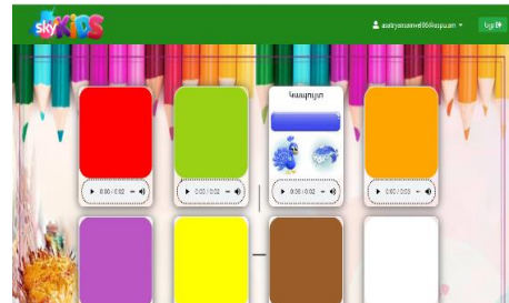
Նկ. 6. Գույներ

Մշակված համակարգի կիրառման արդյունավետությունը ստուգելու համար կազմակերպվել է նաև փորձարկ Երևանի մի քանի մասնավոր նախակրթարաններում: Փորձարկին մասնակցել է ավելի քան 65 երեխա: Փորձարկի վերջում հետազոտվել է սովորական և համակարգով աշխատանքի արդյունավետության դինամիկան ստուգողական և փորձարարական խմբերում: Ընդ որում՝ ստացված արդյունքները դիտարկվել են ըստ բարձր, միջին և ցածր մակարդակների: Փորձարկի վերջում երեխաների զար-