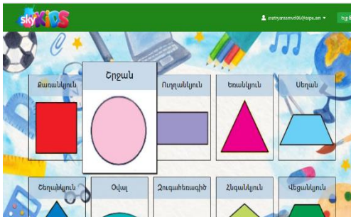
Նկ. 5. Պատկերներ