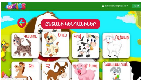
Նկ. 3. Ընտանի կենդանիներ

ենք համակարգի հիմնական էջ: Հիմնական աշխատանքային էջում համակարգը օգտատիրոջն առաջարկում է ընտրել բաժինը (նկ. 2): Համակարգն առաջարկում է ոչ միայն թվեր, տառեր, այլև երեխաներին ծանոթացնում է գույների, կենդանիների, տարվա եղանակների, մրգերի, տարբեր երկրաչափական պատկերների հետ: Յուրաքանչյուր բաժին պարունակում է նաև ենթաբաժին և այսպես շարունակ: Համակարգի նախագծման հիմքում հաշվի են առնվել հետևյալ սկզբունքները՝ զարգացվածության ապահովում տարբեր բնագավառներից, համակարգի կիրառման դյուրություն, թեմաների շարունակականություն՝ պարզից ավելի բարդ: Հետազոտողները հիմնավորել են, որ երեխաներն առավել արագ ընկալում են երևույթները, երբ տեսողական տեղեկույթը ուղեկցվում է լսողական, ձայնային տեղեկատվությամբ: Այստեղ նույնպես համակարգը հնարավորություն է տալիս: Մեղմելով ենթաբաժնի ամեն մի պատկերի վրա՝ համակարգը երեխային պատմում է տվյալ երևույթի մասին, կազմակերպում ինտերակտիվ հարցուպատասխան (նկ. 3, 4, 5, 6): Բացի դրանից՝ համակարգում ներդրված է նաև հարցերի, խաղերի բաժին, որտեղ ներառված խաղերը զարգացնում են երեխաների հիշողության գործընթացները, ստիպում երեխային իրականացնել մտային տարբեր գործընթացներ՝ մտապահում, վերարտադրություն, երկխոսելու, հարց-պատասխան վարելու կարողություն և այլն: