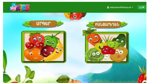
Նկ. 4 Մրգերի և բանջարեղեն