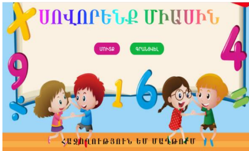
Նկ. 1. Համակարգի առաջնաէջ

Հետազոտության նորույթ: Երեխա-մանկավարժ փոխգործակցությունն առավել հետաքրքիր, ինտերակտիվ դարձնելու նպատակով մշակվել է նախադպրոցական տարիքի երեխաների ընդհանուր զարգացվածության ապահովման աջակցման էլեկտրոնային վեբ համակարգ, որն իր տեսակով եզակի է հայ իրականության մեջ, հեշտ է կիրառման տեսանկյունից և ապահովում է բարձր արդյունավետություն: