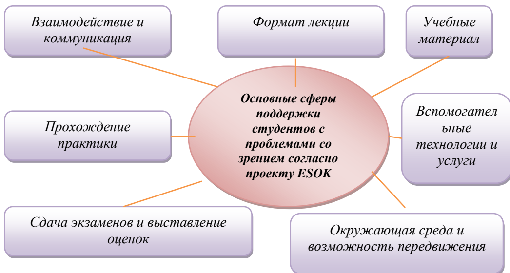
Рис. 2. Основные сферы поддержки студентов с проблемами с нарушением зрения согласно проекту ESOK.

Одновременно, в рамках программы было разработано руководство для преподавателей для работы со студентами с нарушениями зрения, с описанием необходимых приемов и методов, а также форм поведения при работе со студентами в различных ситуациях (Рис. 2).