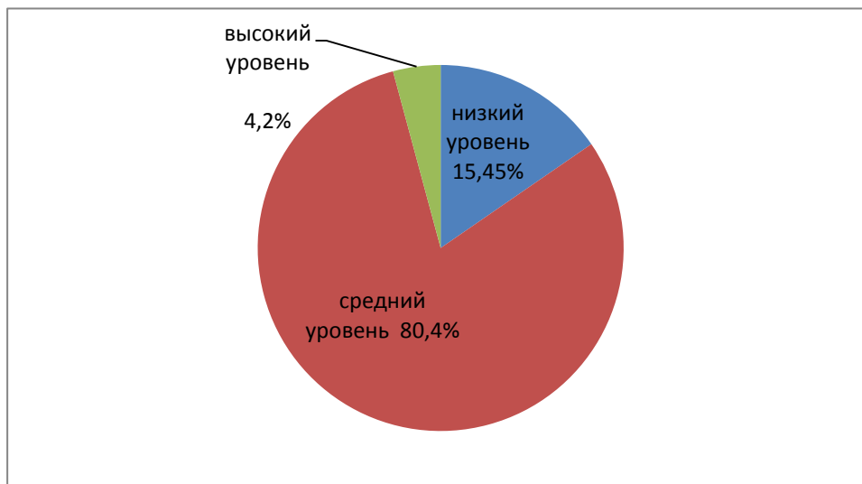
Рис. № 3. Процентное соотношение студентов гуманитарного профиля 1 и 4 курсов обучения с низким, средним и высоким уровнем импульсивности.

Наглядно видно, что нет существенной разницы и в средних значениях полученных результатов 2-х исследуемых групп. Поэтому мы суммировали всю выборку в 97 человек и получили следующие результаты уровней импульсивности студентов гуманитарного профиля, отразив процентное соотношение студентов на Рис.№ 3.