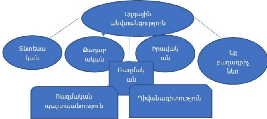
Երկրի ազգային անվտանգության համակարգի պարզագույն սխեման

Դիցուք՝ «Ռազմական անվտանգություն», «Ռազմական պաշտպանություն» և «Դիվանագիտություն» ենթահամակարգերը t -րդ ժամանակահատվածի համար ներկայացվում են համապատասխանաբար S(s_1, s_2, \dots, s_n) , M(m_1, m_2, \dots, m_k) և D(d_1, d_2, \dots, d_i) բնութագրիչ վեկտորներով: Այդ դեպքում կարելի է ասել, որ S -ը ֆունկցիա է M -ից և D -ից՝