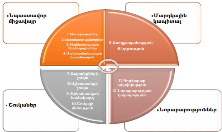
Գծապատկեր 1. Գլոբալ մրցունակության 12 ենթաինդեքսներն ըստ ենթախմբերի

2018-ից սկսած* գործարար մրցունակության ինդեքսի (ԳՄԻ) 4.0-ի կիրառմամբ արտադրողականության վրա ազդող գործոնների 103 ցուցանիշները խմբավորվում են 12 ենթաինդեքսների մեջ, որոնք, ելնելով բովանդակային առանձնահատկություններից, բաժանվում են 4 խմբի՝ բարենպաստ միջավայր, մարդկային կապիտալ, շուկաներ և նորարարություններ (տե ս գծապատկեր 1):