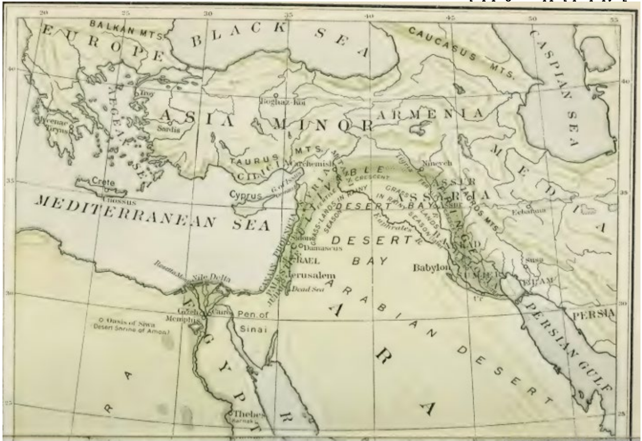
Նկար 1. Բերրի/արգավանդ կիսալուսնի քարտեզը [ըստ Breasted 1914, 56-57]:

Նկատառումներ Հայկական լեռնաշխարհում ուշ բրոնզ – վաղերկաթեդարյան պատմամշակութային որոշ զարգացումների վերաբերյալ