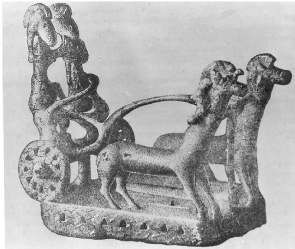
Նկար 4. Լճաշենի № 1 դամբանաբլրում հայտնաբերված մարտակառքի բրոնզե մանրակերտը: