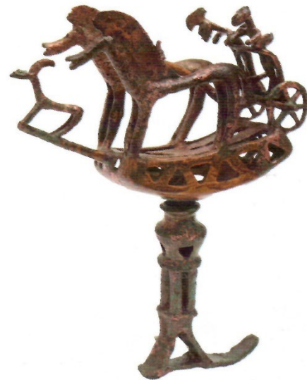
Նկար 5. Լոռի բերդի № 7 դամբարանում գտնված մարտակառքի բրոնզե մանրակերտը [ըստ Դեվեջյան 2022, 84, նկ. 85]: