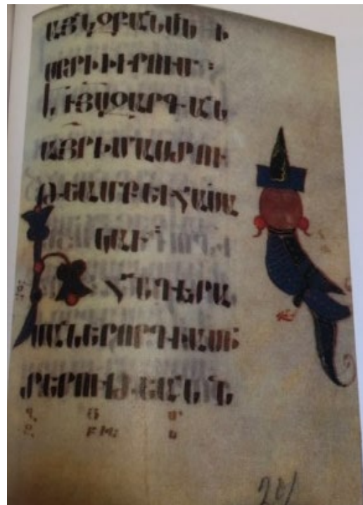
Պտկ. 21. Ձեռ. № 2952