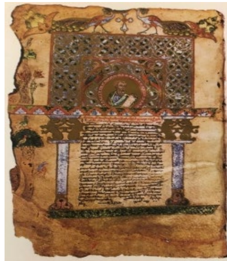
Նկ. 2. Հռոմկլայի ավետարան