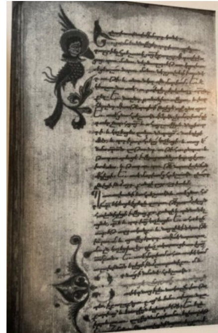
Պտկ. 26. Ձեռ. № 346