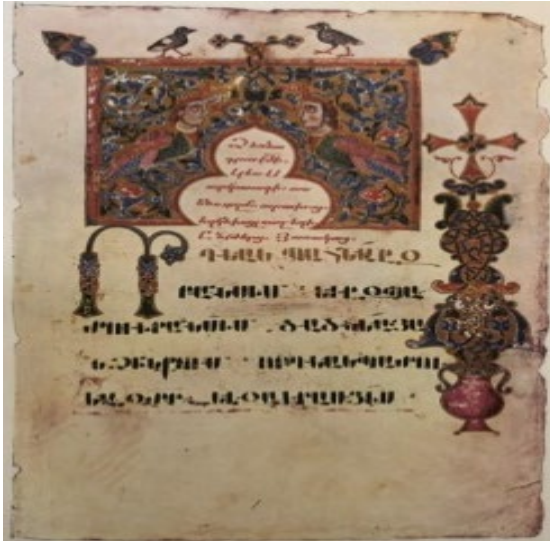
Նկ. 3. Գիրք ձեռնադրութեանց