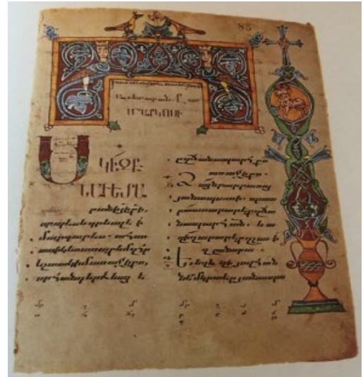
Նկ. 4. Հռոմի ավետարան