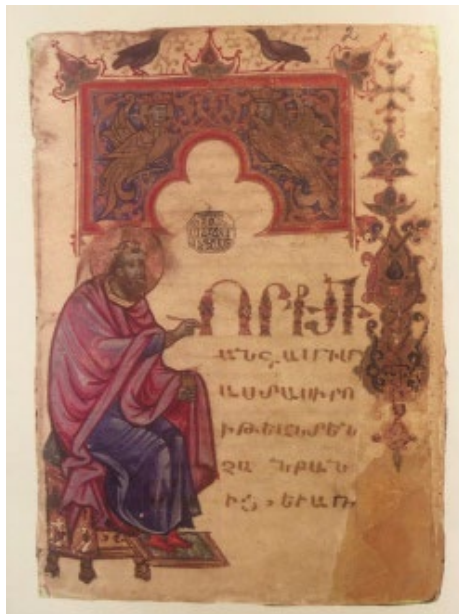
Պտկ.8 Ձեռ. № 1746