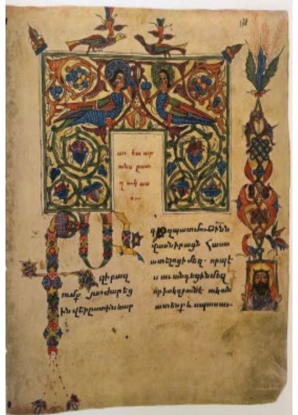
Պսկ. 11. Ձեռ., № 3722