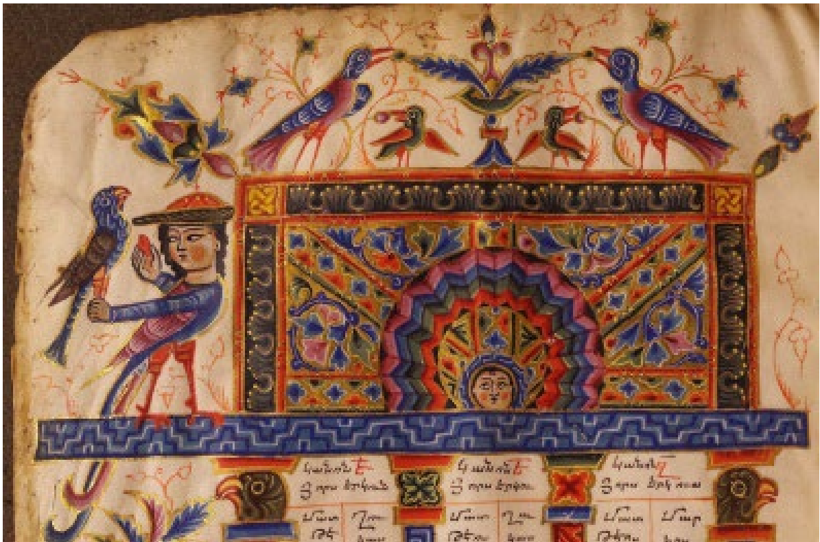
Պսկ. 13. Ձեռ. №1917