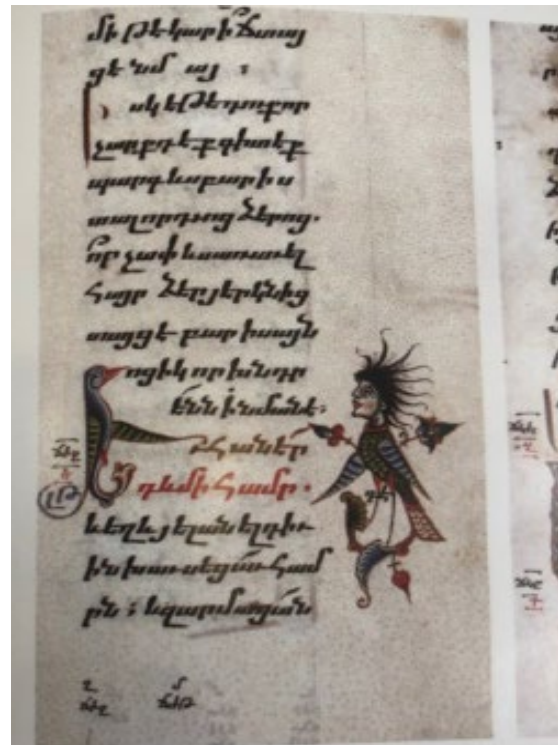
Պտկ. 24. Ձեռ. №5786