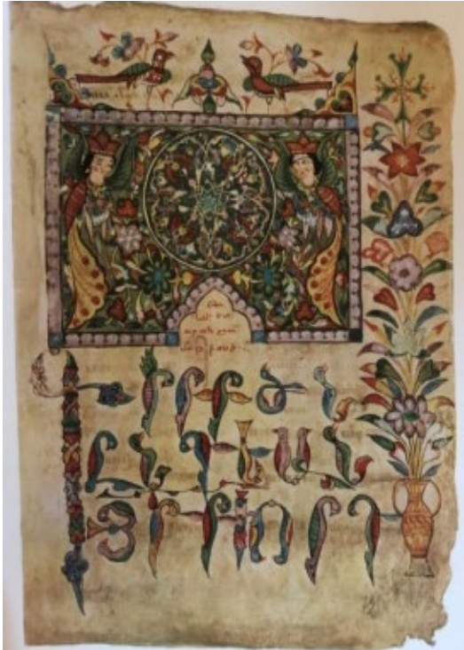
Պտկ. 19. Ձեռ. № 6305