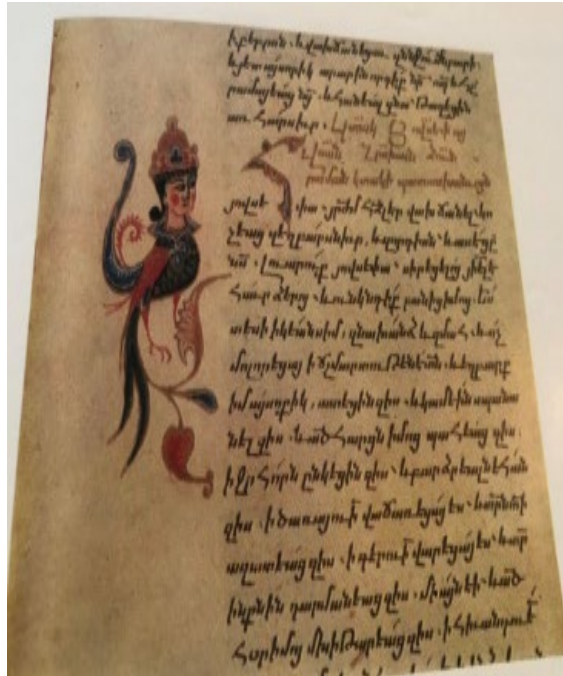
Պտկ. 25. Ձեռ. № 346