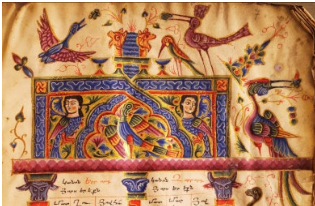
Պսկ. 12, Ձեռ. №1917