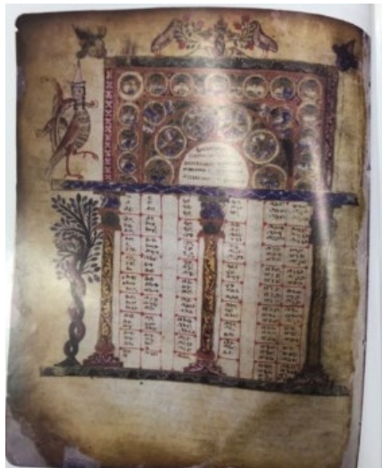
Նկ. 1. Հաղբատի ավետարան

Պատկերելով երկու մարմիններ՝ մանրանկարիչը նկատի է ունեցել մարդկային ու աստվածային էությունները, իսկ մարդկային գլուխը, որն ունի թագի պատկեր, հավանաբար Քրիստոս Աստվածն է, որը շարժում է այդ երկու ուժերին: Թարգմանչաց ավետարանի «Տիրամոր նինջը» ներկայացնող տեսարանում հուշկապարիկների պատկերումը ևս մեկ անգամ հաստատում է այն տեսակետը, որ վերջիններս ավետաբեր էակներ էին և այստեղ ավետում էին Տիրամոր երկինք տեղափոխվելը: Հուշկապարիկի պատկերների հանդիպում ենք այն տեքստերի հարևանությամբ, որոնցում ասվում է. «Կանչողի ձայնը անապատումը՝ պատրաստ արեք տիրոջ ճանապարհը. և ուղիղ արարեք զշաւիղ ընտրա...»: Այս տեքստերի հարևանությամբ հուշկապարիկների պատկերներ հայտնվում են ոչ միայն խորաններում, այլ նաև լուսանցագարդերում: Այդպիսով կանչողի ձայնը քրիստոնեական շրջանում ավետում էր Քրիստոսի գալուստը և ճանապարհի բացում մարդկանց համար դեպի քրիստոնեական հավատքը: Այդպիսի օրինակ մենք արդեն տեսանք № 2952 Մ. ձեռագրում և Հռոմի ավետարանում: Ուսումնասիրված հուշկապարիկների պատկերների մեծամասնությունը կարմիր ու կապույտ են: Կարմիրը խորհրդանշում է Աստծու որդու գոհաբերած արյունը, անձնագոհությունը, իսկ կապույտը աստվածայինի, երկնքի, հավերժության գույնն է, համահունչ է խոնարհությանը, բարեպաշտությանը: Այնուամենայնիվ, նյութի ուսումնասիրությունը չենք կարող ավարտված համարել. դեռ շատ կան նոր ու չլուսաբանված ձեռագրեր հայ մանրանկարչության մեջ, որոնց մանրագին վերլուծությունները կարող են լուսաբանել նաև հուշկապարիկ-սիրենների դերի ու նշանակության մասին հայ միջնադարյան արվեստում: