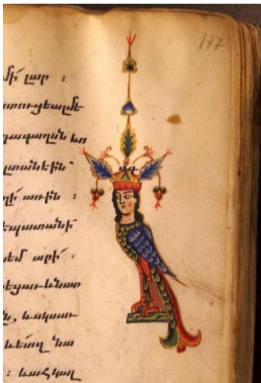
Պտկ. 23. Լուսանցագարդ 1331 թ.