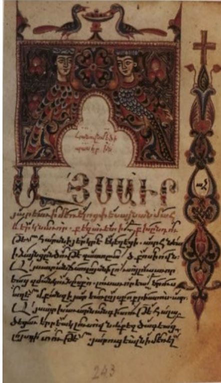
Պսկ. 15 Սարգիս Պիժակի կողմից ստեղծված շարակնոց