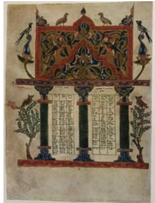
Նկ. 6. Կիլիկիայի ձեռագիր