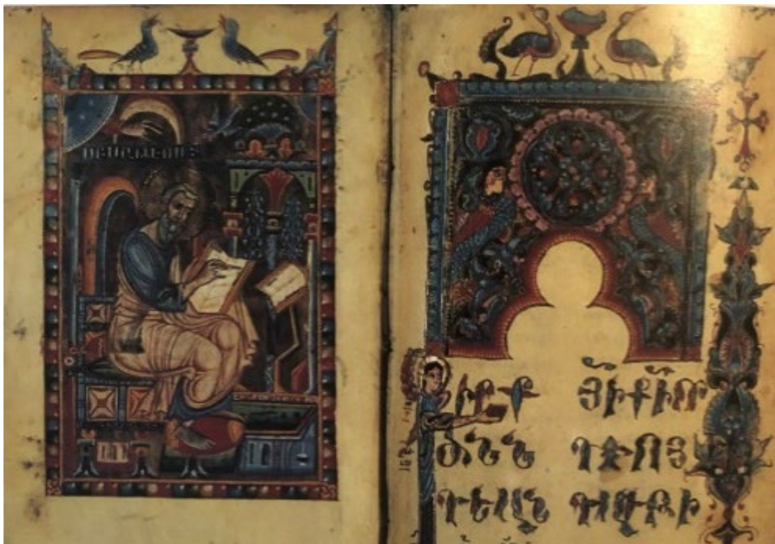
Պսկ. 14. Ձեռ. №1949