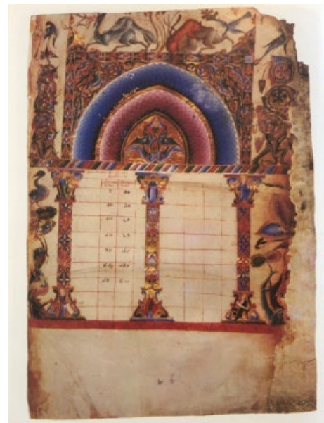
Պտկ. 9 Ձեռ. № 9422