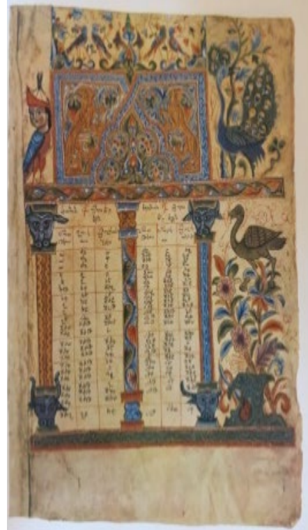
Պսկ. 16. Ձեռ. № 6289