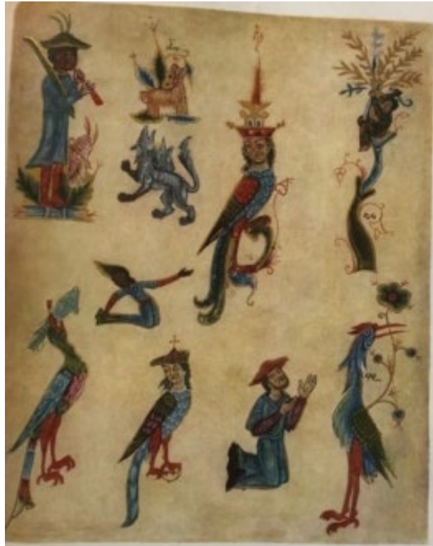
Պտկ. 22. 1323 թվի ձեռագիր