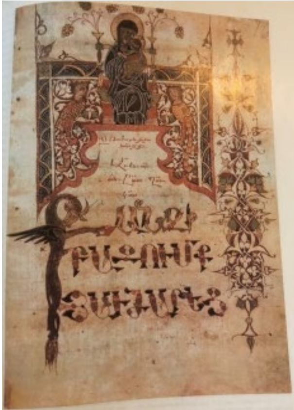
Պսկ. 10. Ձեռ. № 4820