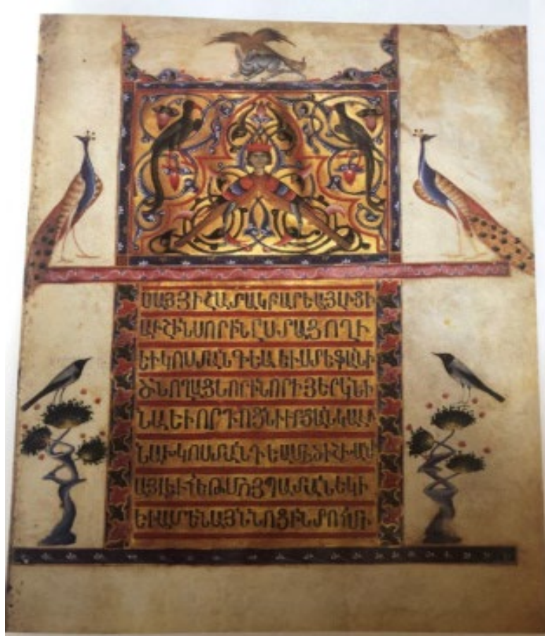
Պտկ. 7. Օշին Մարաջախտի ավետարան