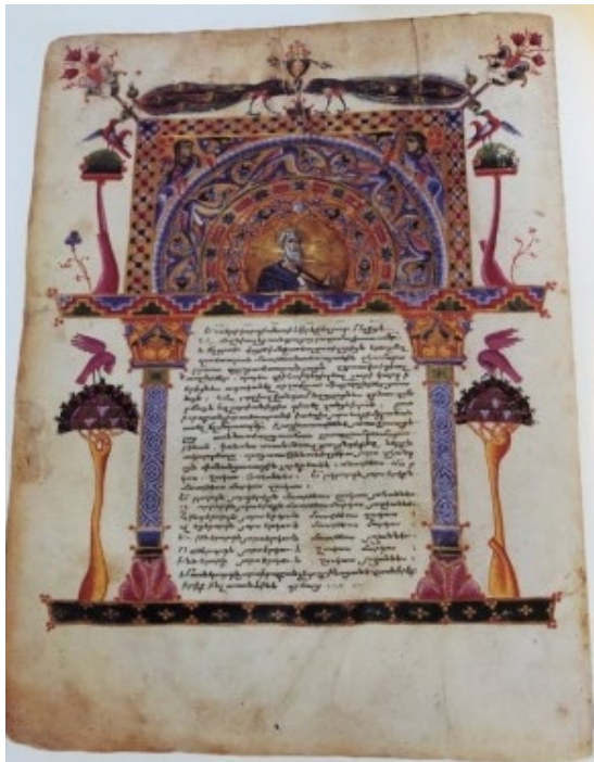
Նկ. 5. Զեյթունի ավետարան