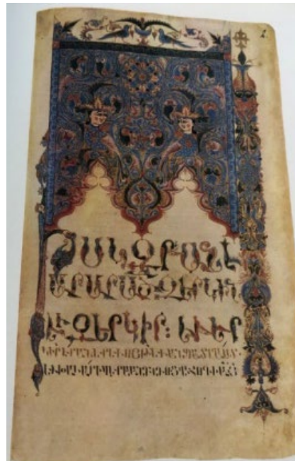
Պսկ. 18. Ձեռ. № 346