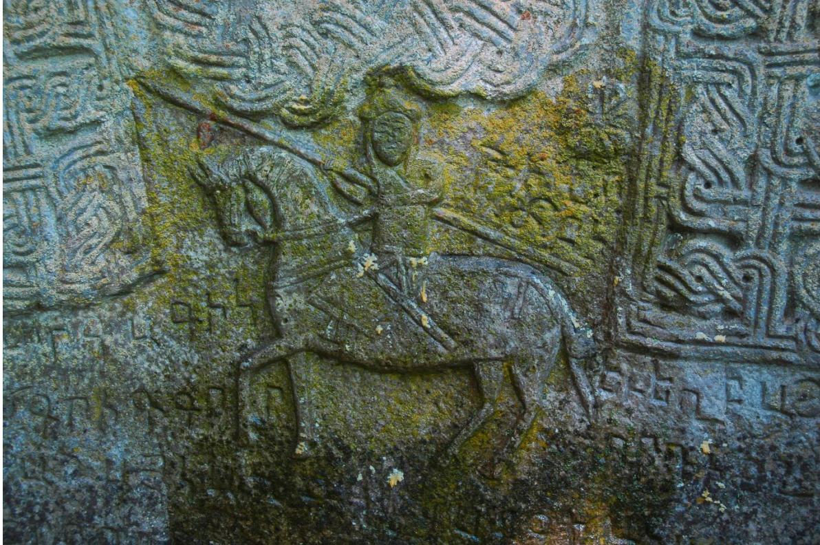
Նկ. 4. Հեծյալ ռազմիկ, խաչքարային պատկերաքանդակ, 1203 թ., Կոշիկ անապատ: