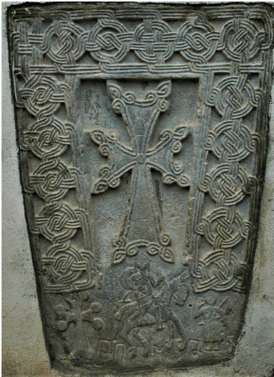
Նկ. 1. Հեծյալ ռազմիկը, 1200 թ., Վաճառ

պատրաստ լինելը, ռազմիկի դերակատարման կարևորության ընկալումը մերձավորների, իշխանների, եկեղեցու և ողջ հանրութի կողմից մնում էին անփոփոխ: Կենսընթացն ընկալվում էր որպես հավերժ կռիվ, որին պիտի միշտ պատրաստ լինել, ինչն էլ պայմանավորել է քննարկվող քանդակների կերպարային ու թեմատիկ բազմազանությունը, գիտական քննության առումով ուշագրավությունն ու արդիականությունը: