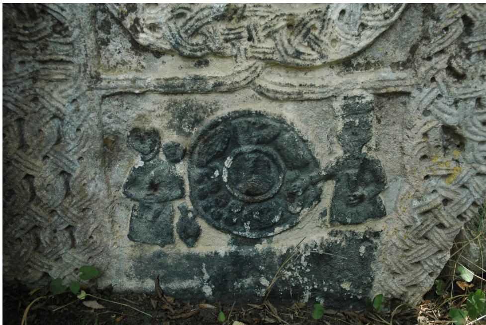
Նկ. 7. Խնջույք, ընտանիք, խաչքարային պատկերաքանդակ, 1253 թ., Շիկաքար, լուս.՝ Հ. Պետրոսյանի: