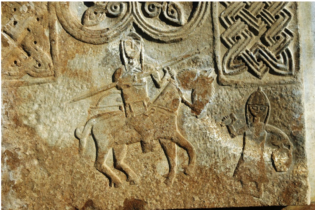
Նկ. 5. Հեծյալ ռազմիկներն ու մատովակը, խաչքարային պատկերաքանդակ, XII-XIII դարեր, Պառավաձոր: