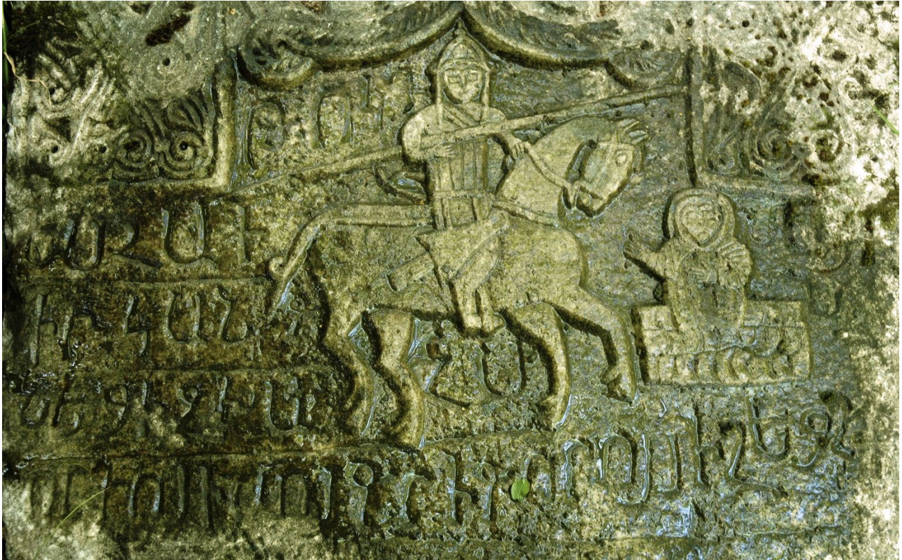
Նկ. 9. Մայրը և ռազմիկ որդին, խաչքարային պատկերաքանդակ, 1212 թ., Կոշիկ անապատ, լուս.՝ Հ. Պետրոսյանի: