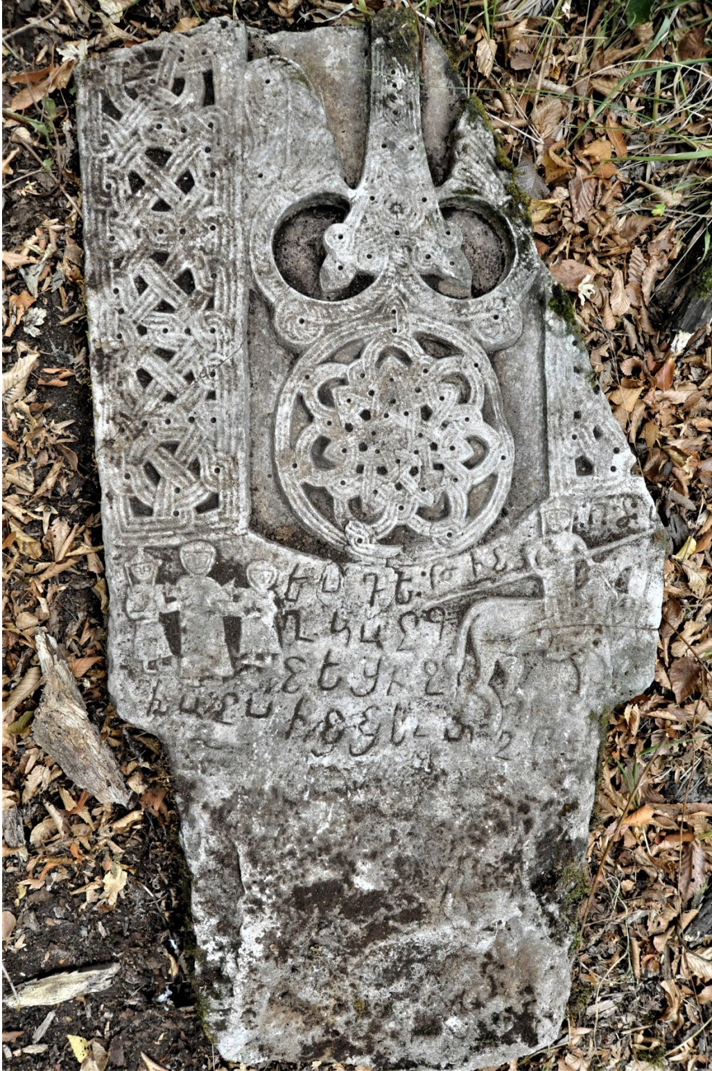
Նկ. 8. Հեծյալ ռազմիկն ու իր ընտանիքը, խաչքարային պատկերաքանդակ, 1202 թ.,