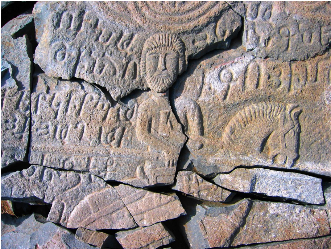
Նկ. 6. Հեծյալ ռազմիկը գինու գավաթով, խաչքարային պատկերաքանդակ, XII-XIII դարեր, Հանդաբերդի վանք: