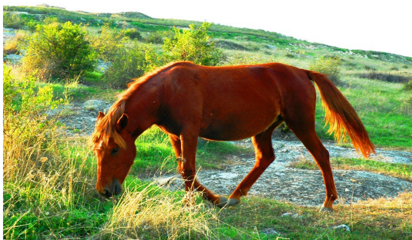
Նկ. 3. Արցախյան ձի: