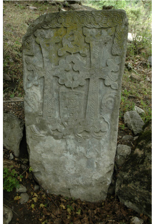
Նկ. 2. Հետիոտն ռազմիկներ, 12-13-րդ դարեր, Ծմակահող