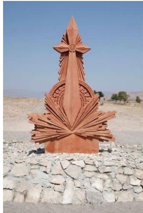
Նկ. 9. Թուր-խաչ, լուս.՝ Վ. Համբարձումյանի: