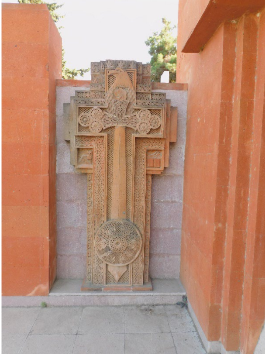
Նկ. 8. Խաչքար «ռազմական» թեմատիկայով, լուս.՝ Ա. Գրիգորյանի: