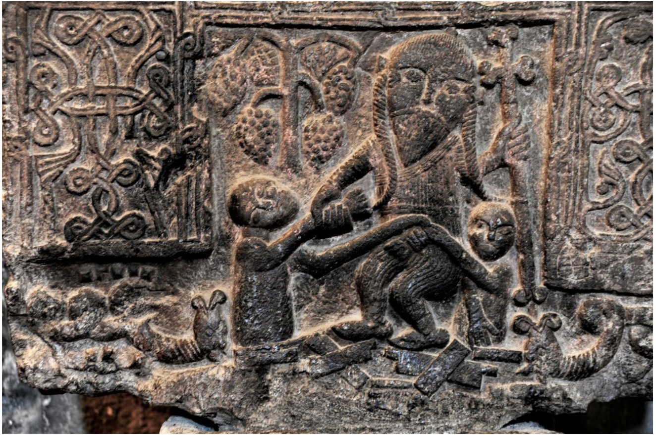
Նկ. 1. Սևանի Առաքելոց վանքի խաչքար (1653 թ.):