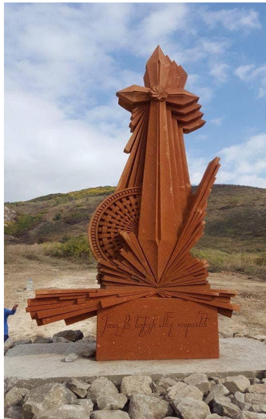
Նկ. 10. Թուր-խաչ: