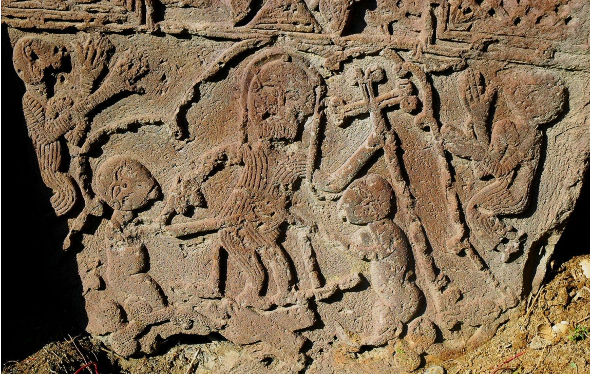
Նկ. 3. Հացառատիխաչքար (1551 թ.):