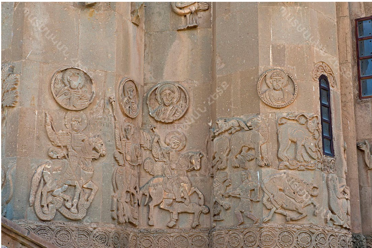
Նկ. 4. Աղթամարի Սուրբ Խաչ եկեղեցու հյուսիսային ճակատին երեք հեծյալ սրբերի պատկերազրույթունը, լուս.՝ patmakanhetq.com-ի: