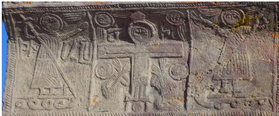
Նկ. 7. Գավառի Սուրբ Ստեփանոս մատուռի հյուսիսում 1707 թ. խաչքարի մանրամասն, լուս.՝ Ս. Բաղդասարյանի: