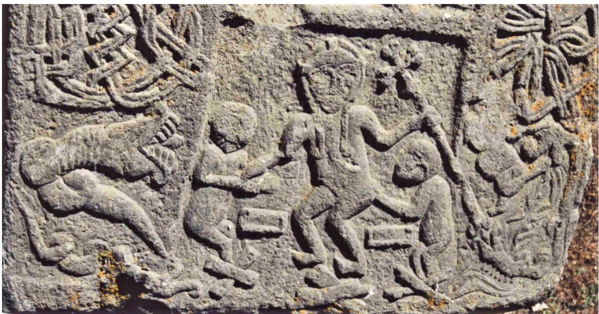
Նկ. 2. Նորատուսի խաչքար (XVI-XVII դդ.):