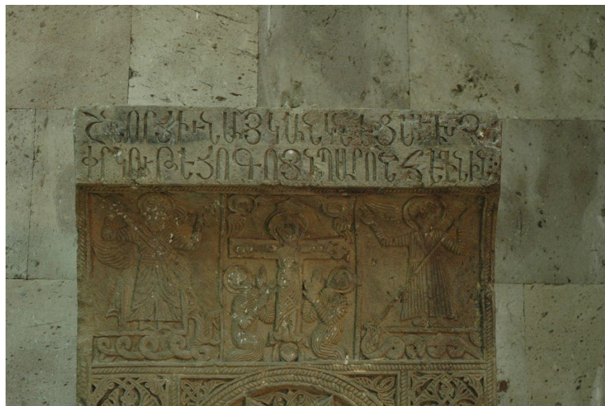
Նկ. 6. Առինջի խաչքարի մանրամասն (1548 թ.):