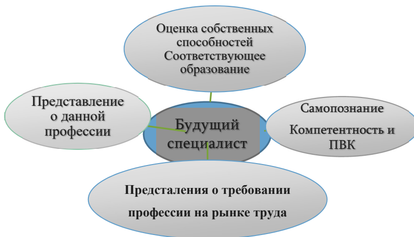
Рис. 2. Обеспечение эффективности будущего специалиста

Профессиональная компетентность включает углубленные профессиональные знания и рассматривается как характеристика качеств подготовки специалиста, потенциала эффективности в профессиональной деятельности. Профессиональную компетентность молодежи возможно обеспечить путем стимулирования их самостоятельности. Она является необходимой составляющей профессионализма и формируется в процессе профессиональной подготовки через умения, способности и личностные качества. Исследуя личностно-социальные качества будущих специалистов, необходимо выделить такие, с помощью которых возможно преодолеть трудности на пути становления профессионала. С помощью знаний, навыков и компетенций, молодые специалисты, достигшие высоких результатов, исходя из собственных стремлений, могут раскрыть пути для новой карьеры и самоактуализации.