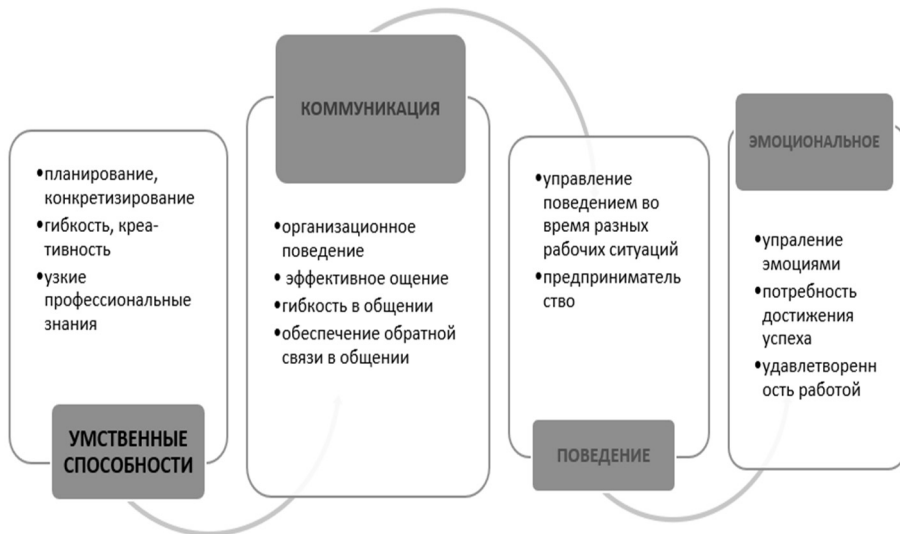
Рис. 3. Личностные и профессиональные качества, обеспечивающие самостоятельность будущего компетентного специалиста

С точки зрения психологической оценки личности, поэтапная перспектива процесса формирования образовательных намерений учащегося охватывает самые близкие достижимые цели до мечты о будущем. Завершение любого этапа обучения предполагает новый выбор, продолжение и новое понимание преемственности и новую цель, которая в дальнейшем послужит профессиональной подготовке и трудовой деятельности.