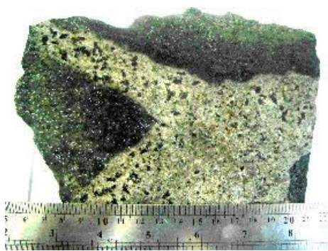
Рис. 3. Интрузивное взаимоотношение турмалиновых гранитоидов Ванкской интрузии с вмещающими породами.

Среди турмалиновых гранитоидов отмечаются маломощные единичные мелкозернистые дайки турмалиновых гранит-аплитов и гранодиорит-порфиров. Ознакомление с формой залегания мелкозернистого ксеноморфного турмалина и его аллотриоморфных взаимоотношений с кварцем и полевыми шпатами убеждают в первично магматической природе турмалина жильно-магматических пород раннего этапа. В то же время турмалиновые гранитоиды Ванкского массива рассекаются также мощными дайками позднего этапа гранодиорит-порфиров, диорит-порфиритов и диабазовых порфиритов без первичной или вторичной минерализации турмалина.