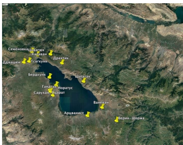
Рис. 4. Карта сел, участвовавших в социологическом опросе.

Мы можем представить также следующие рекомендации: