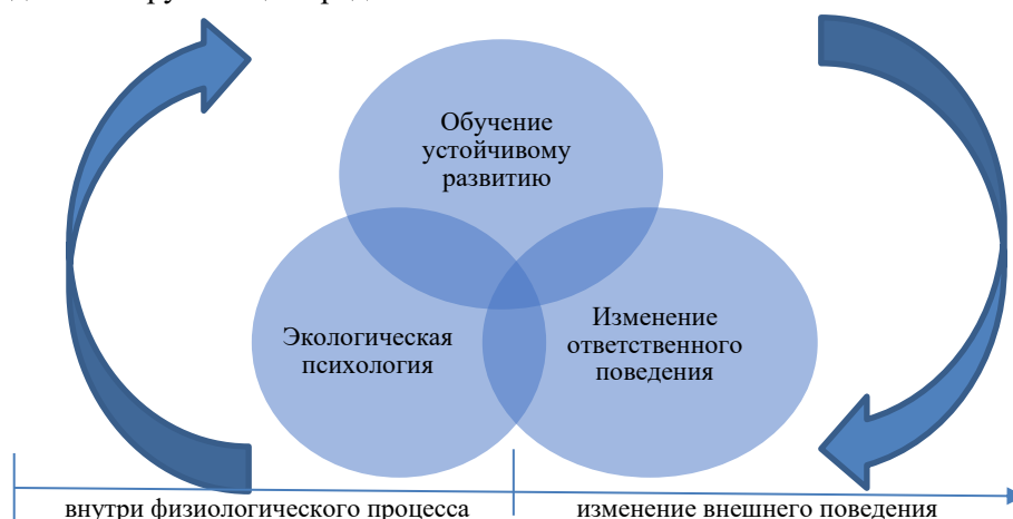
Рис. 1. Схема восприятия устойчивого развития [8].

изменение ответственного поведения. Эти три концепции необходимы для формирования у людей представлений об устойчивости. Важно определить, какое действие является внутренним механизмом взаимодействия между людьми и окружающей средой.